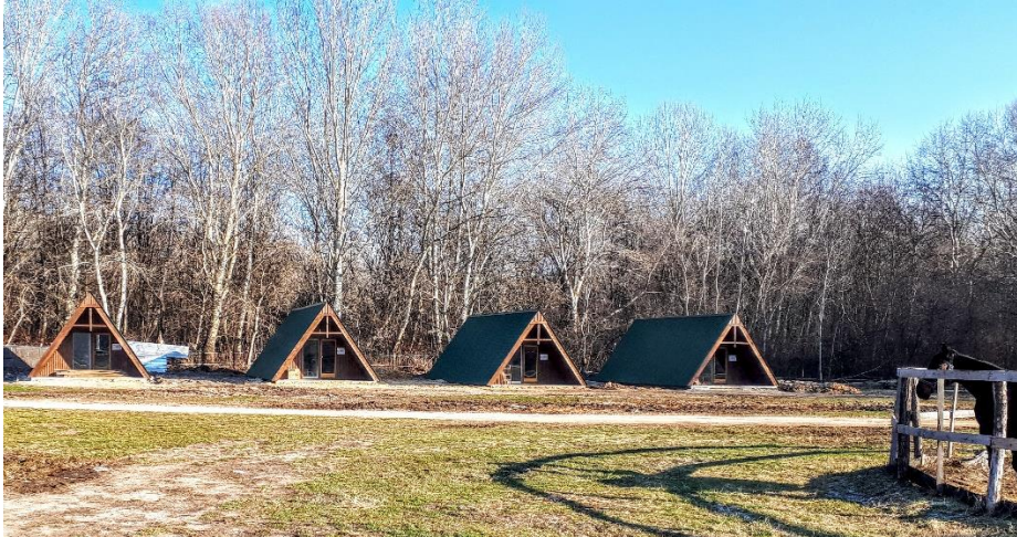
egyedi szállásfejlesztés Pákozd, Classic Horse

A nyertesek nagy része elkezdte a megvalósítást, örömmel láthatjuk, hogy valóban jó minőségű innovatív fejlesztések valósulhatnak meg a Velencei-tó körül. Biztató, hogy nagyon sok jó fejlesztési elképzelésre adtak be támogatási kérelmet az ügyfelek, amelyek kapcsolódnak az egyéb nagyobb beruházásokhoz, és várhatóan elősegítik a minőségi szolgáltatások körét, amivel a térség versenyképes tud maradni az országos turisztikai kínálatban.