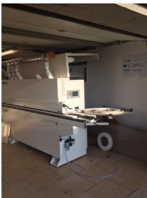
Homag-élzárógép (Pro-Holz Kft.)