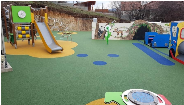
Különleges játszótér a sukorói Gémeskút vendéglőnél (Nagy Roland)